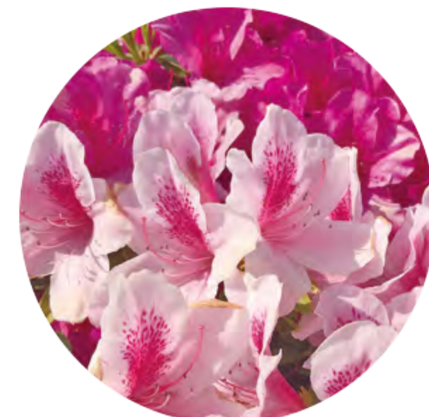
杜鹃花 (4月下旬~5月中旬)