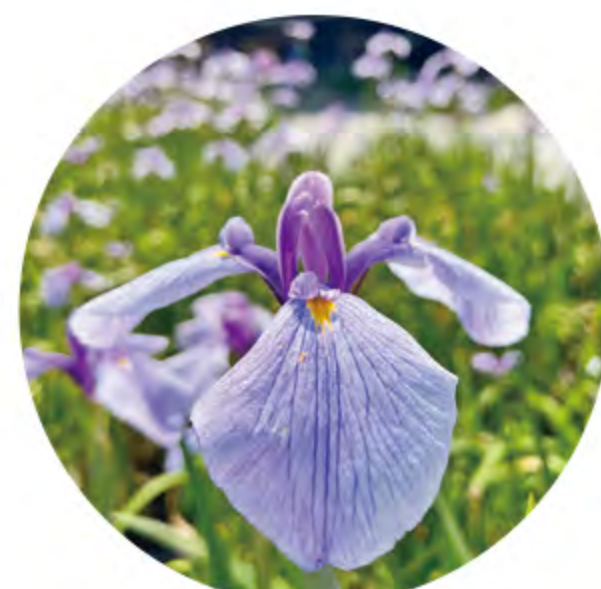
菖蒲花 (5月下旬~6月中旬)