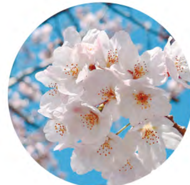
櫻花 (3月下旬~4月上旬)