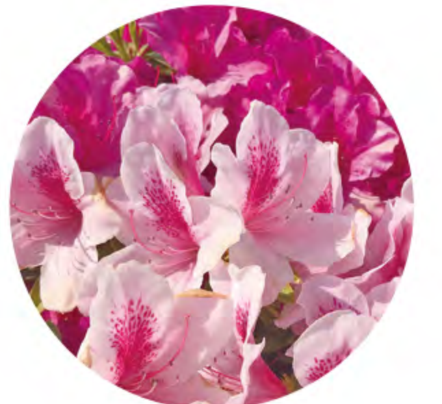
杜鵑花 (4月下旬~5月中旬)